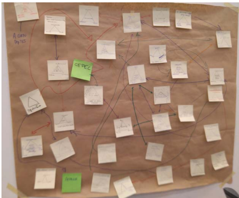
Mural Grup 2 Núria Canals

Es destaquen algunes observacions o conclusions d'aquesta dinàmica.